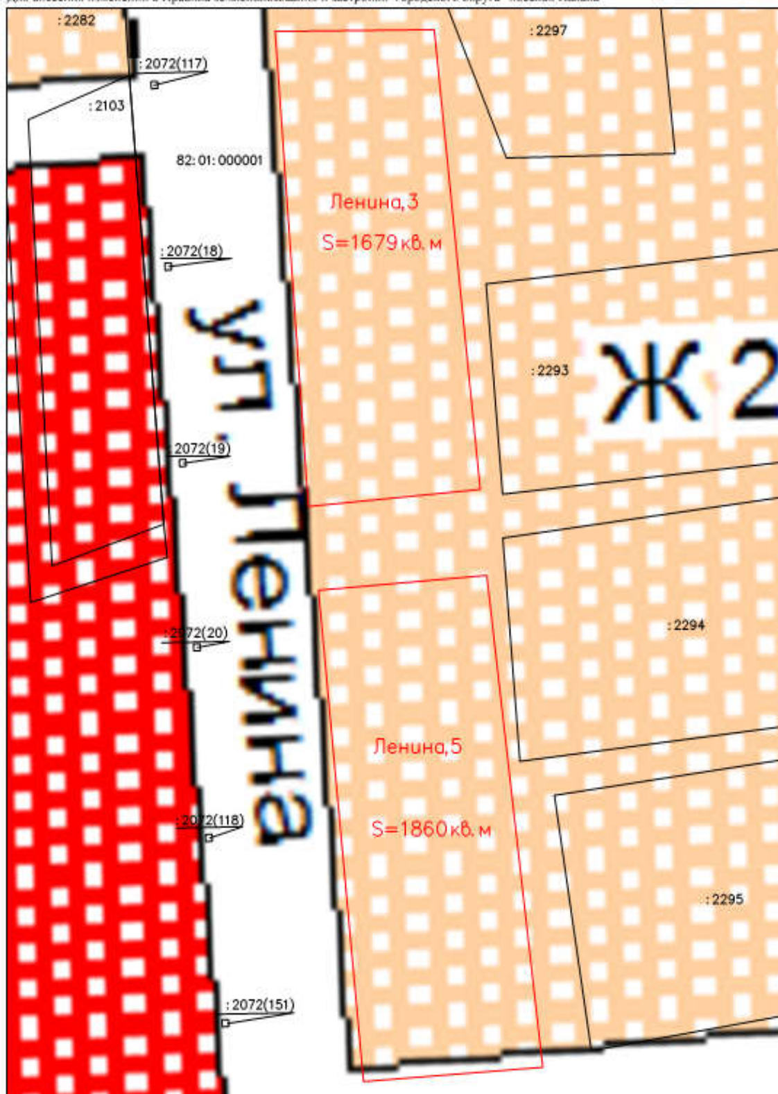
Схема расположения земельного участка под застройку среднетажными жилыми домами расположенного: край Камчатский, городской округ «поселок Палана», ул. имени Владимира Ильича Ленина, д.3 д.5 Для внесения изменений в Правила землепользования и застройки городского округа «поселок Палана»